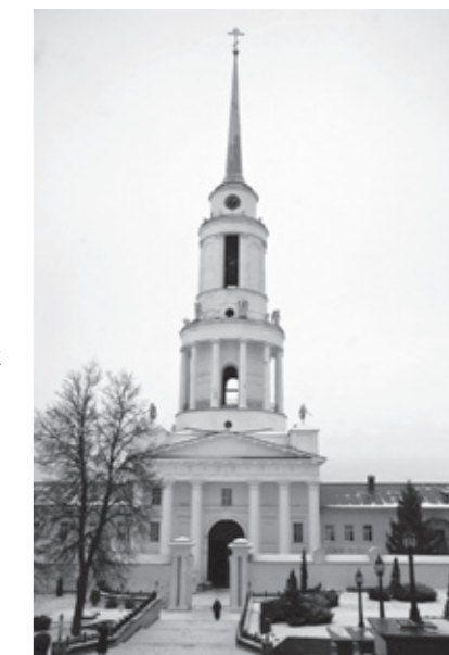
Задонский Рождество-Богородицкий монастырь

По мере набора группы каждую субботу и воскресенье организуются паломнические поездки по Пензенской области: Соловцовка, Оленевка, Большая Валяевка, Нижний Ломов, Наровчат, Вадинск, Саганье, Семиключье, Чаадаевка.